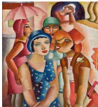
2- Cinco moças de Guaratinguetá.