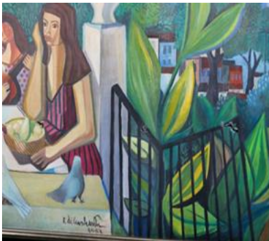
1- https://www.culturagenial.com Mulatas.

21. As imagens representam obras de Di Cavalcanti, exceto: