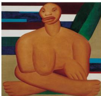
3- https://artebrasileiraufpr.wordpress.com A negra.